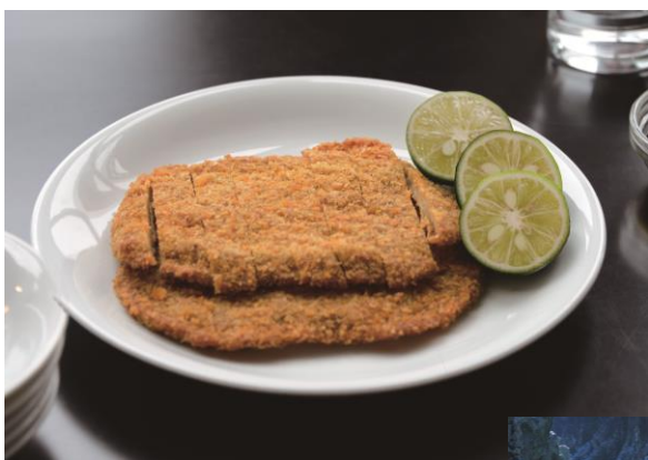
フィッシュカツ (徳島県)