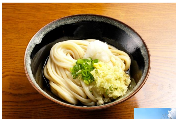
讃岐うどん (香川県)