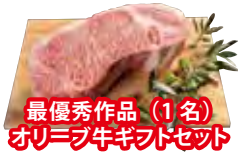
最優秀作品 (1名) オリミツギフトセット