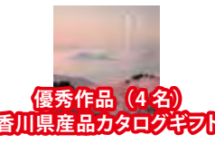
優秀作品 (4名) 香川県産品カタログギフト