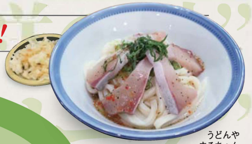
うどんや まるちゃん

2019年 販売期間 10月5日(土)~翌1月中旬頃 (オリーブハマチ販売終了まで)