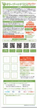
スタンプラリー 応募専用はがき