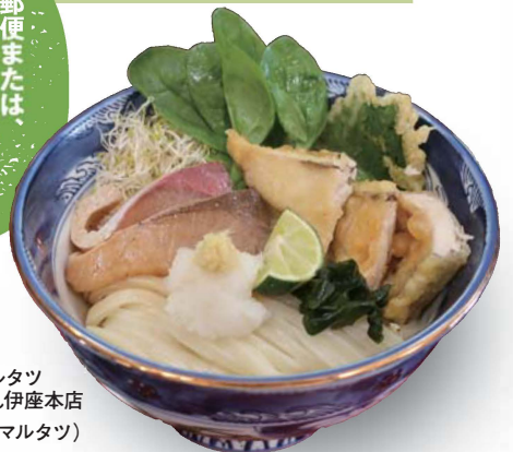
東かがわマルタツ 手打ちうどん伊座本店 marutatsu(マルタツ) 三本松店