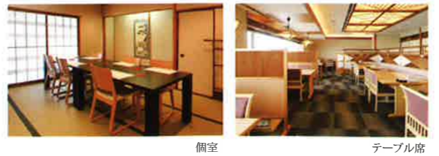
個室 テーブル席 ※仕入れ状況によりメニューが変更になる場合がございます。ご了承ください。

月花 お一人様 7,000円(税込¥7,560) 8品 この他にも、お料理等ご予算に応じてご用意させていただきます。 ご遠慮なくご相談くださいませ。