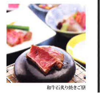
和牛石炙り焼きご膳

ベジファースト 推奨 野菜を最初に食べることで血糖値が上昇しにくくなり、脂肪の吸収が抑えられるので、同じ食事内容でも太りにくくなります。 ふるさと紀行「香川県」開催中! 日本で一番小さい県ながら美味しいものいっぱい「香川県」。「讃岐牛」「讃岐米」をお楽しみいただけます。