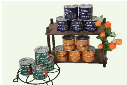
<食品部門> さぬき逸品ハンバーグ缶(デルカフェ)