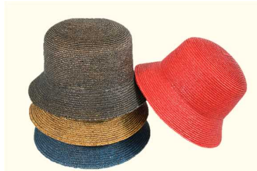
<一般部門> うる むぎ漆ぼうし (有限会社 丸高製帽所)