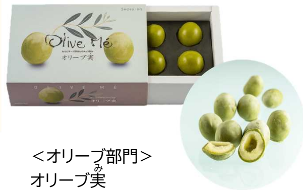
<オリーブ部門> み オリーブ実 (株式会社 松風庵かねすえ)