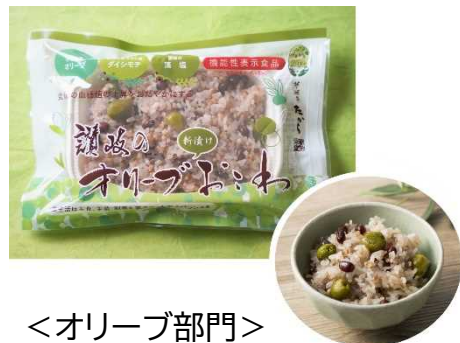
<オリーブ部門> 讃岐のオリーブ新漬けおこわ (株式会社 夢菓房たから)