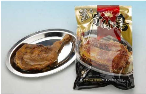
<食品部門> 薫る 骨付鳥(株式会社 おがた食研)