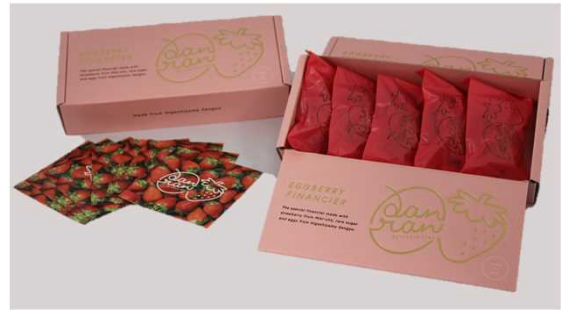
<菓子・スイーツ部門> エッグベリー・フィナンシエ egg berry・financier (農事組合法人 東山産業)