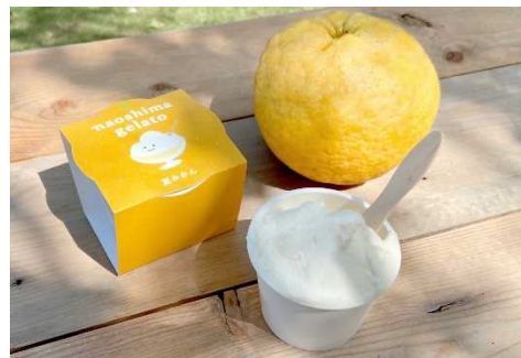
<菓子・スイーツ部門> naoshima gelato 直島ジェラート (直島ガーデン 株式会社)