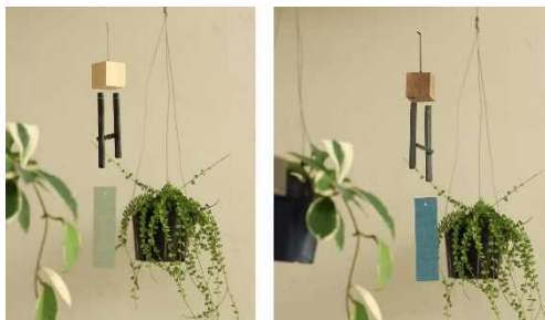
<一般部門> サヌカイト風鈴(ひのき)(ウオルナット) (有限会社 平井石産)