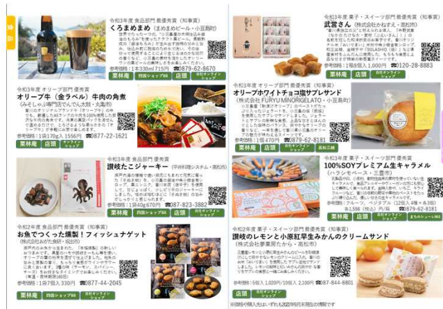
PRパンフレットイメージ

令和4年度を含む20年間の入賞作品の中で、現在販売中の商品を掲載したPRパンフレットを制作し配布するとともに、香川の県産品ポータルサイト「LOVEさぬきさん」( https://www.kensanpin.org/ )に公開します。(10月中旬予定)